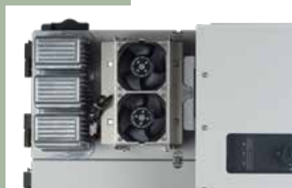
Wymienny moduł mocy