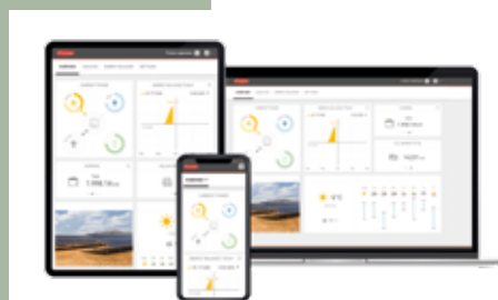
Oprogramowanie Fronius Solar.web